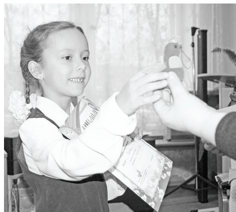
Мальшам подарили игрушки.